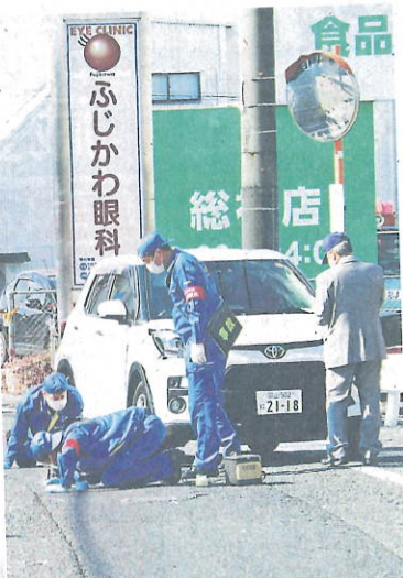
歩行者がはねられた事故現場—4日午前11時10分、岡山県総社市

4日午前8時35分ごろ、岡山県総社市総社1丁目の国道180号上で乗用車が歩行者に突っ込み、幼稚園に登園中だった女児2人とそれぞれの保護者の女性2人がはねられた。県警によると、4人のうち女児(4)と女性が意識不明の重体と